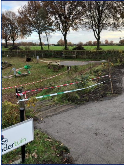
Helling in aanleg begin december